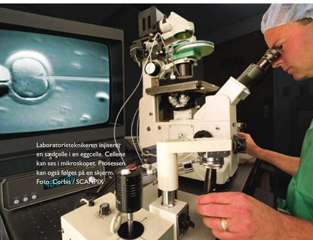
Laborarieteknikeren injiserer en sædcelle i en eggcelle. Cellene kan ses i mikroskopet. Prosessen kan også følges på en skjerm.

Risikoen for misdannelser er vesentlig høyere ved flerlingesvangerskap. Tidligere var flerlingesvangerskap vanlig ved assistert befruktning fordi man satte inn flere egg for å øke sjansen for at kvinnen skulle bli gravid. I dag har metodene blitt bedre. Derfor er det gjerne nok å sette inn ett (eller to) egg. Antallet trillingfødsler er derfor kraftig redusert, men fortsatt er opp mot 30